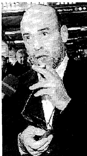
Ritaglio stampa ad uso esclusivo del destinatario, non riproducibile.